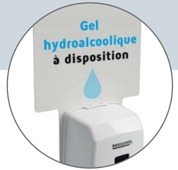
Plaque signalétique neutre (personnalisable en option)